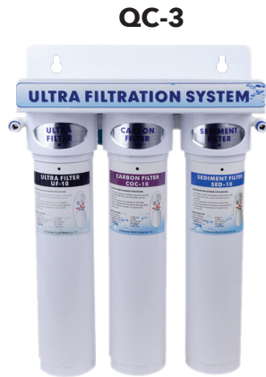
11.8" w x 4.5" d x 14.3" h