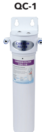
2.8" w x 3.2" d x 12.4" h