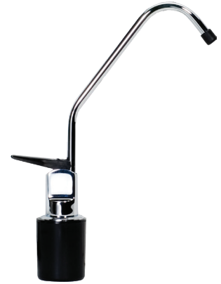
Grifo estándar de cromo incluido. Grifos de diseño disponibles.