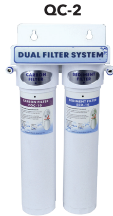
6.3" w x 3.9" d x 13.4" h